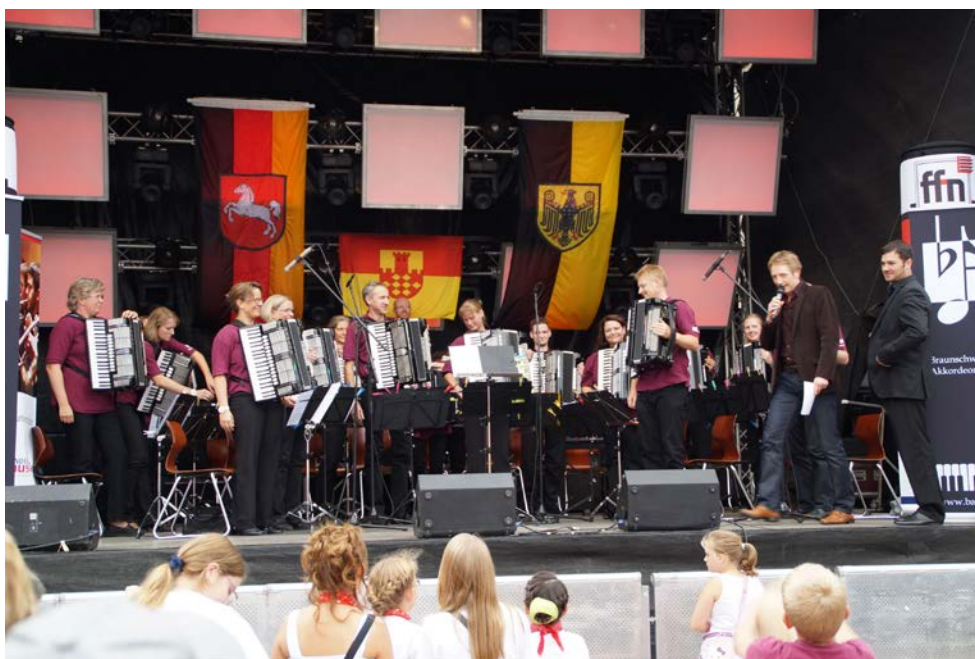
Das Braunschweiger Akkordeon-Orchester beim Tag der Niedersachsen in Goslar

Der nächste Auftritt des BAO wird am 08. Dezember 2013 das Weihnachtskonzert in der St. Andreaskirche Braunschweig sein. Weitere Infos unter www.bao-ev.de .