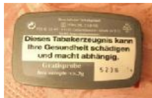
Vorder- und Rückseite einer Tabakdose